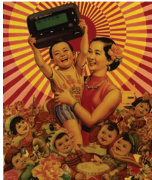
ルオ兄弟 《我、北京天安门を愛す》 1996-97 写真、コンピュータ・グラフィック、水彩、漆、板

みんなが楽しく暮らせる社会であって欲しい。そんな理想の場所をもとめて、人々は地上に楽園を夢見てきました。そこには社会の理想が映しだされています。個人ではなく、社会全体にとっての幸福。ここから、この展覧会＝幸せを求める旅は始まります。