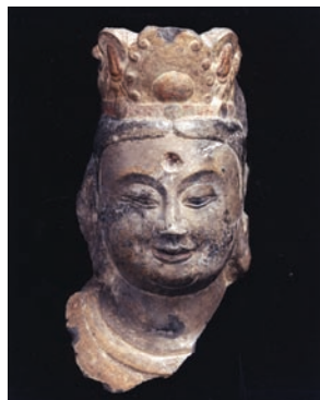
中国、北齊時代 《菩薩頭》 550-570 石灰岩

地上の世界から一転して、物質や肉体から解放された世界を旅します。そこには、永続する精神的な幸福感が静かに広がっています。あたかも宇宙の神秘を目前に感じるような、畏敬に満ちた空間。その雰囲気にもふさわしく、仏像、抽象画などが多く展示されます。