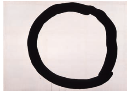
吉原治良 《無題(白地に黒の円)》 1967 油彩、キャンバス

あらゆる葛藤の中でバランス地点を見いだすことは、今を生きるための大切な知恵といえるかもしれません。そして、幸せを求めて始まったこの旅が、会場を出ても続くことを願っています。